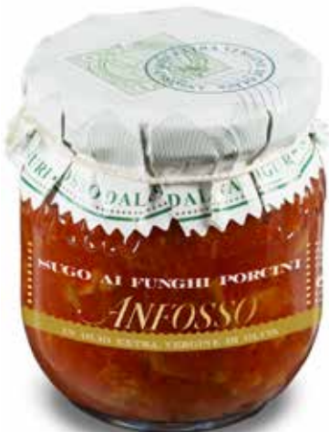
Sugo ai funghi porcini 180 g. cod. 51104