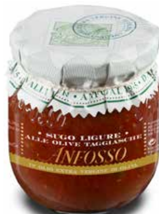
Sugo ligure alle olive taggiasche 180 g. cod. 51113