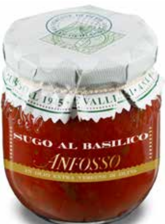
Sugo al basilico 180 g. cod. 51101