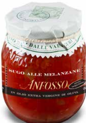
Sugo alle melanzane 280 g. cod. 51126