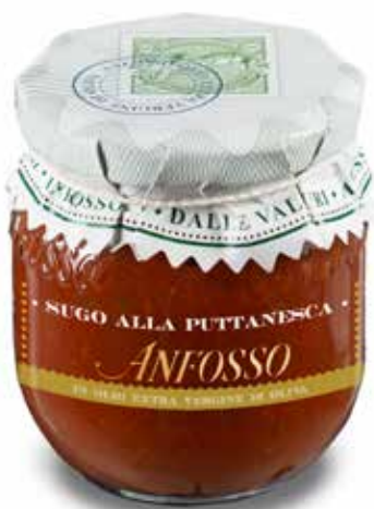
Sugo alla puttanesca 180 g. cod. 51106