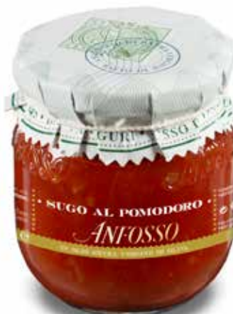
Sugo al pomodoro 180 g. cod. 51100