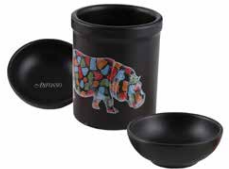
BAR101 Barattolo in ceramica