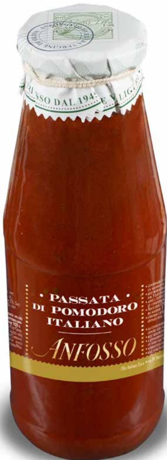
Passata di Pomodoro 680 g. cod. 51107