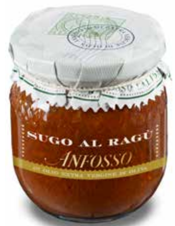
Sugo al ragù 180 g. cod. 51103