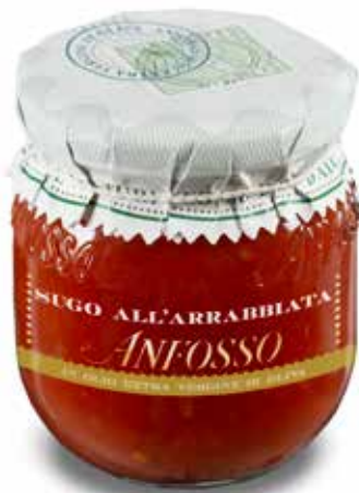
Sugo all'arrabbiata 180 g. cod. 51102