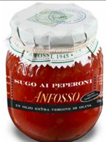
Sugo ai peperoni 280 g. cod. 51127