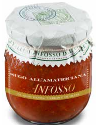
Sugo all'amatriciana 180 g. cod. 51105